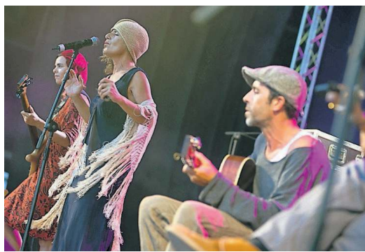
El grupo mayorero Bocinegro durante su actuación en el Womad, anoche.

Inma se licenció en Arquitectura en Italia, estudios que compa-